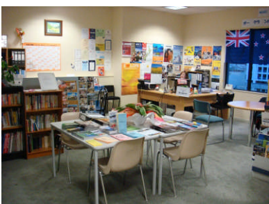
オフィスは明るく、清潔！