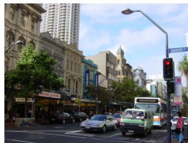
オークランドの中心街クィーンストリート