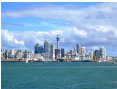
タワーはオークランドのシンボル！

オークランドには、ネクシスのニュージーランド支店があり、空港でのお出迎えはもちろん、滞在中のご相談や緊急時の対応など、すべて日本人スタッフが対応します。