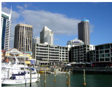
活気あるウォーターフロント