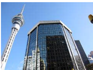
当社オフィス外観