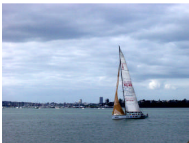
「CITY OF SAILS」と呼ばれるように週末には多くのヨットが見られます。