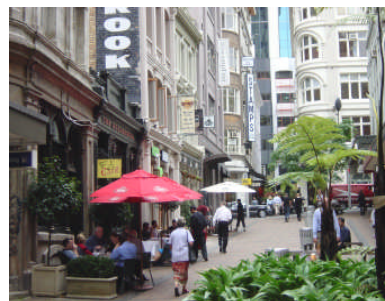
おしゃれなカフェもたくさん！